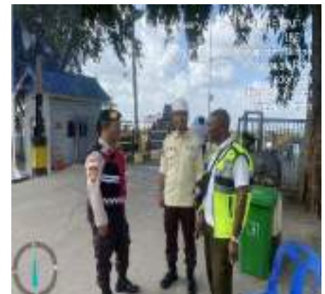
PERSONEL SATSAMAPTA POLRES BINTAN MELAKSANAKAN PATROLI DAN PATROLI DIALOGIS DI KAWASAN OBJEK VITAL TERTENTU WILAYAH HUKUM POLRES BINTAN