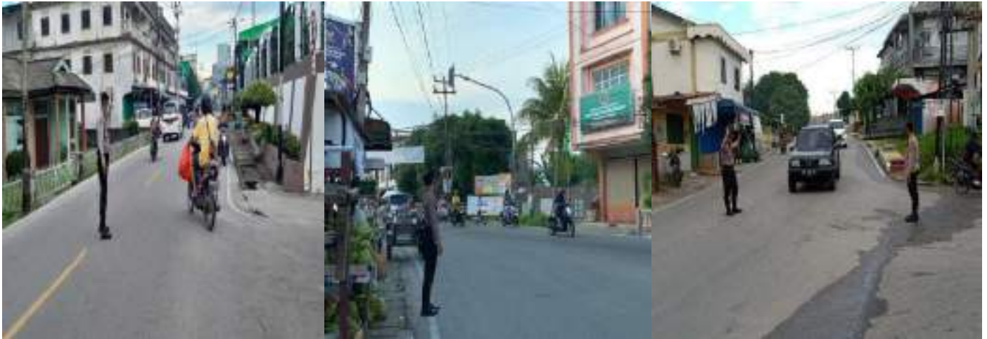
KEGIATAN PENGATURAN SATSAMAPTA CEGAH KEMACETAN LALU LINTAS