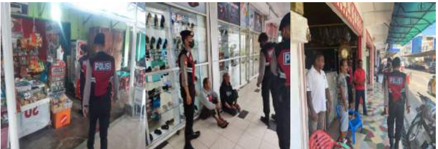
KEGIATAN PATROLI JALAN KAKI SATSAMAPTA POLRES KARIMUN DALAM RANGKA CEGAH GANGGUAN KAMTIBMAS