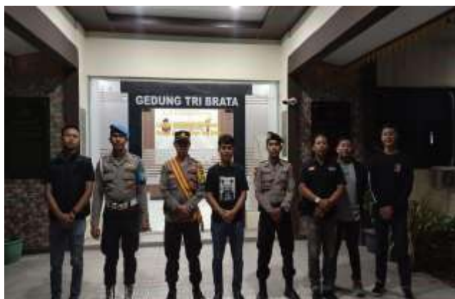
KEGIATAN PENJAGAAN MAKO POLRESTA TANJUNGPINANG