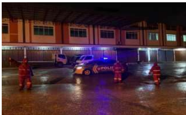
KEGIATAN PENGATURAN SATSAMAPTA POLRESTA TANJUNGPINANG