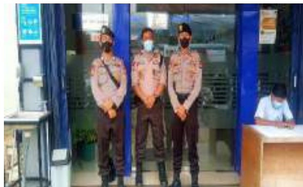
KEGIATAN PAM BANK PNBP