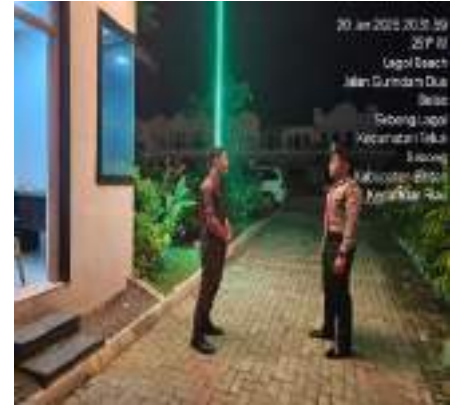
KEGIATAN PATROLI DIALOGIS UNIT PAMOBVIT POLRES BINTAN