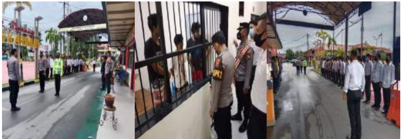
KEGIATAN PENJAGAAN MAKO, SERAH TERIMA DAN PENJAGAAN RUTAN POLRES KARIMUN