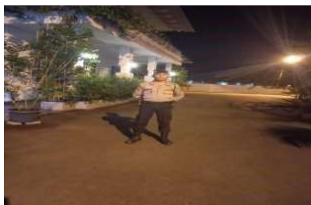
KEGIATAN PENJAGAAN RUMAH SELIGI 1