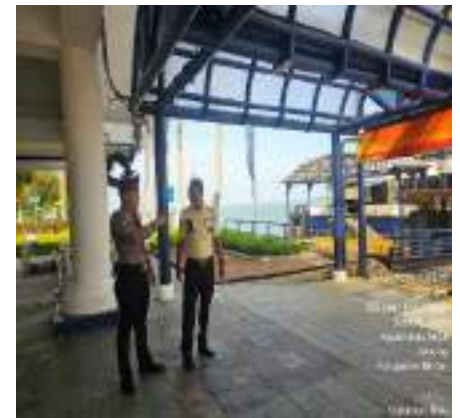
KEGIATAN PATROLI DI TEMPAT KERAMAIAAN UNIT PAMOBVIT POLRES BINTAN DI KAWASAN WISATA LAGOI