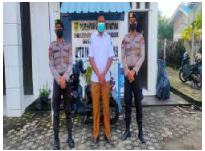
KEGIATAN PATROLI SIANG