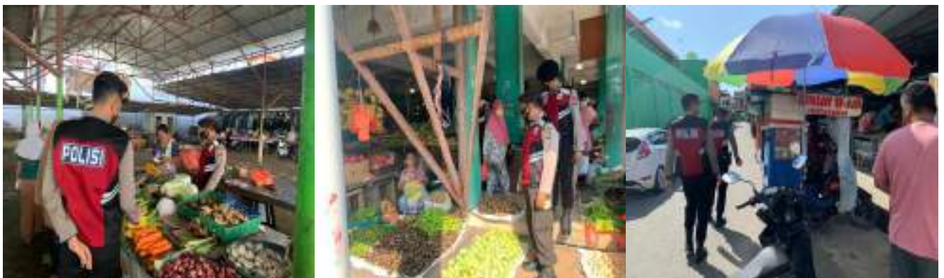
KEGIATAN PATROLI JALAN KAKI SATSAMAPTA POLRES KARIMUN DALAM RANGKA CEGAH GANGGUAN KAMTIBMAS