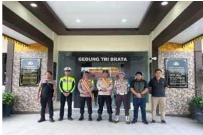
KEGIATAN PENJAGAAN MAKO POLRESTA TANJUNGPINANG