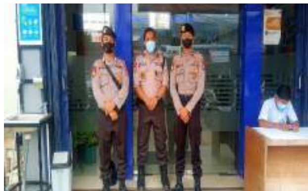
KEGIATAN PAM BANK PNBP