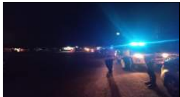
MENJAGA SITUASI KAMTIBMAS YANG KONDUSIF DI WILAYAH KAB. LINGGA