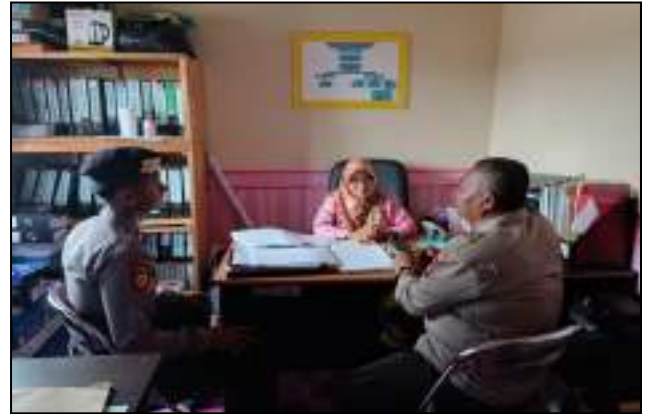
KEGIATAN PATROLI RUTIN SATSAMAPTA DALAM RANGKA MENJAGA SITUASI KAMTIBMAS YANG KONDUSIF