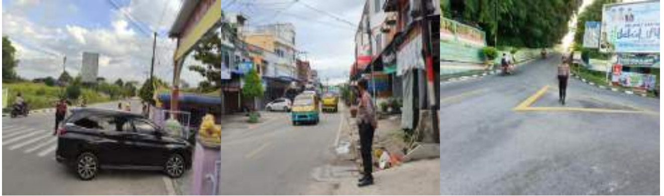
KEGIATAN PENGATURAN SATSAMAPTA CEGAH KEMACETAN LALU LINTAS