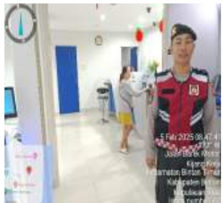
PENGAMANAN BANK BCA CAPEM TANJUNG UBAN DAN KANTOR KAS KIJANG