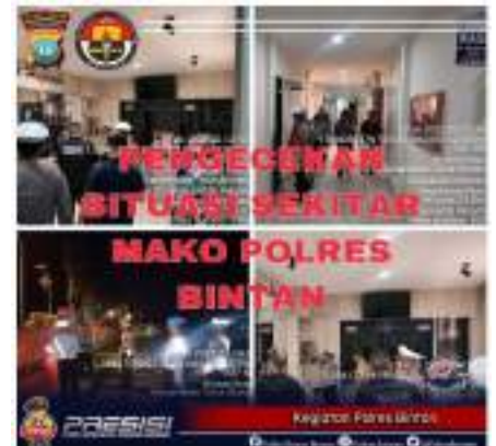
KEGIATAN PENJAGAAN MAKO DAN PENJAGAAN RUANG TAHANAN POLRES BINTAN