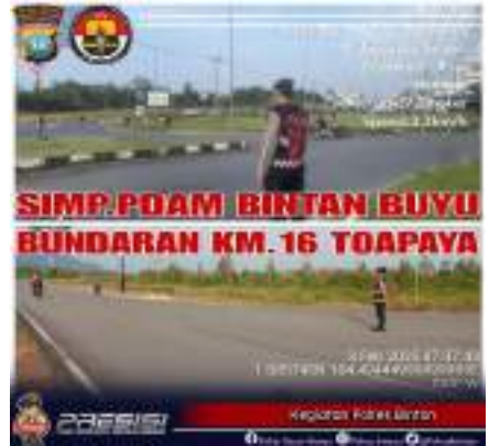
KEGIATAN PENGATURAN DI WILAYAH HUKUM POLRES BINTAN