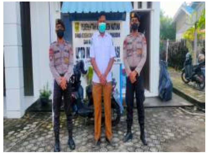
KEGIATAN PATROLI SIANG