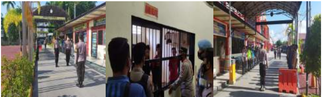
KEGIATAN PENJAGAAN MAKO, SERAH TERIMA DAN PENJAGAAN RUTAN POLRES KARIMUN