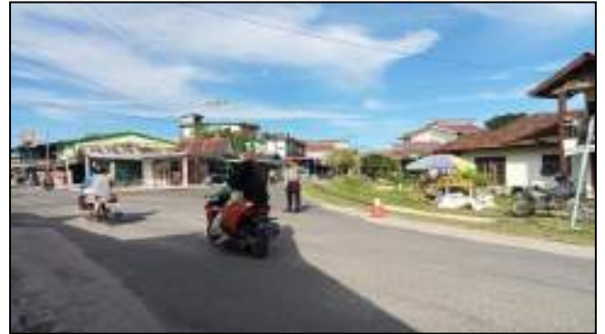
KEGIATAN PENGATURAN ARUS LALULINTAS MOBILITAS BERKENDARAAN SATSAMAPTA