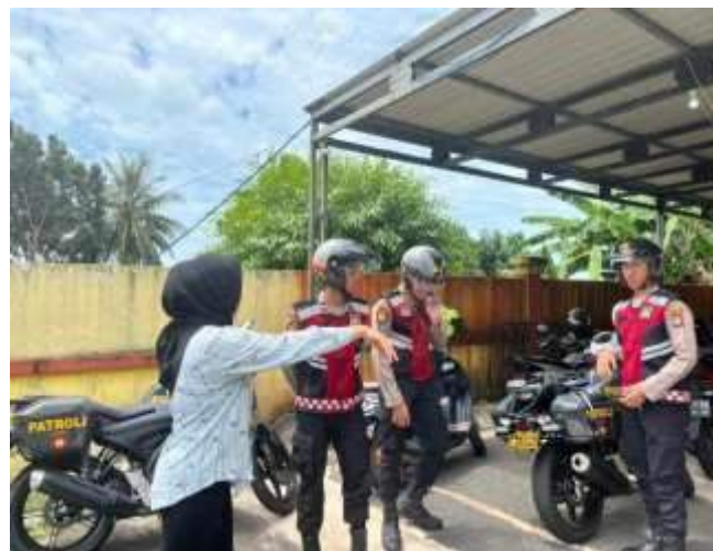
KEGIATAN PATROLI R2 HARKAMTIBMAS SATSAMAPTA POLRESTA TANJUNGPINANG