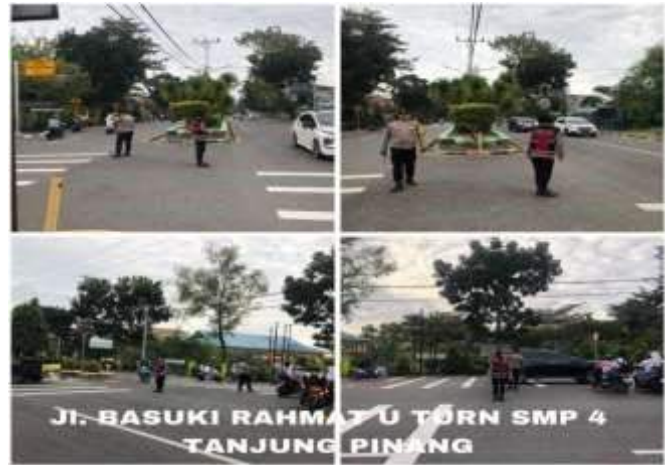
KEGIATAN PENGATURAN SATSAMAPTA POLRESTA TANJUNGPINANG