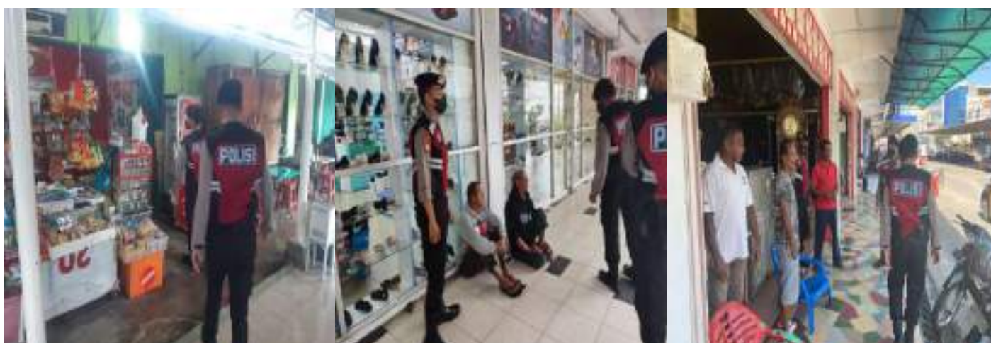
KEGIATAN PATROLI JALAN KAKI SATSAMAPTA POLRES KARIMUN DALAM RANGKA CEGAH GANGGUAN KAMTIBMAS