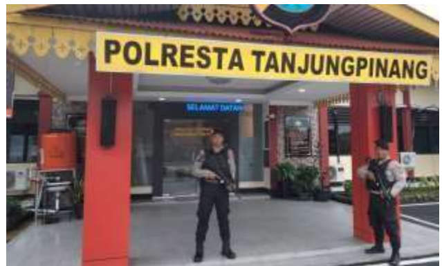
MELAKSANAKAN PIKET PENJAGAAN SPKT MAPOLRESTA TANJUNGPINANG