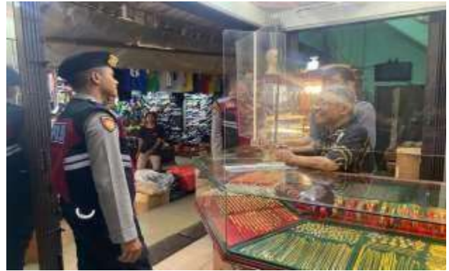
KEGIATAN PATROLI SAT SAMAPTA POLRESTA TANJUNGPINANG DI WILAYAH KEPOLISIAN RESOR KOTA TANJUNGPINANG