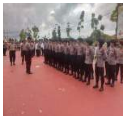
KEGIATAN APEL PAGI SATSAMAPTA POLRES BINTAN