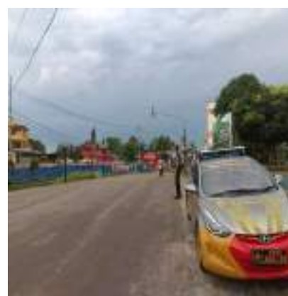
KEGIATAN PENGATURAN DI WILAYAH HUKUM POLRES BINTAN