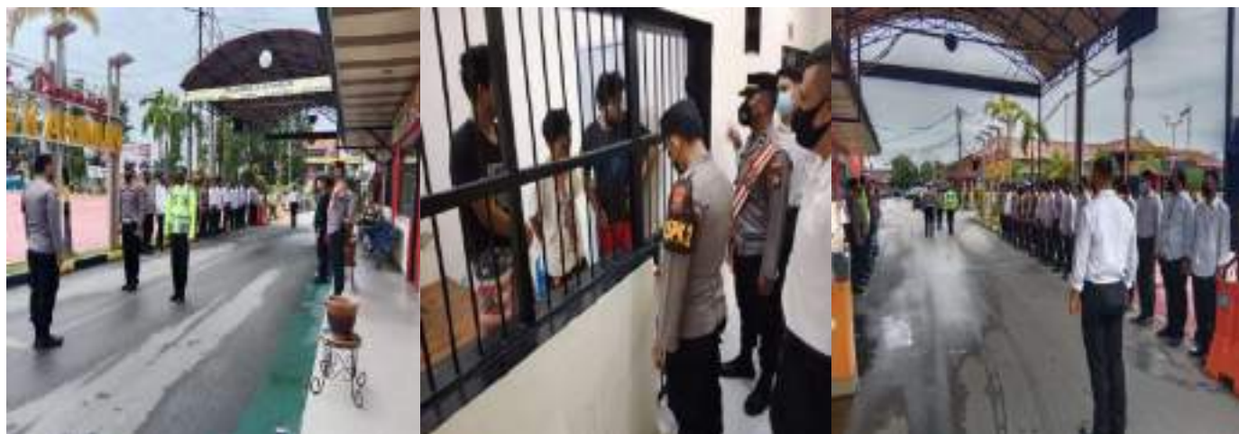
KEGIATAN PENJAGAAN MAKO, SERAH TERIMA DAN PENJAGAAN RUTAN POLRES KARIMUN