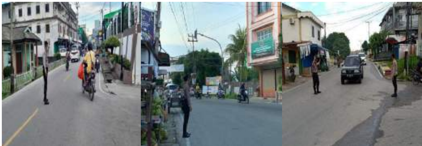
KEGIATAN PENGATURAN SATSAMAPTA CEGAH KEMACETAN LALU LINTAS