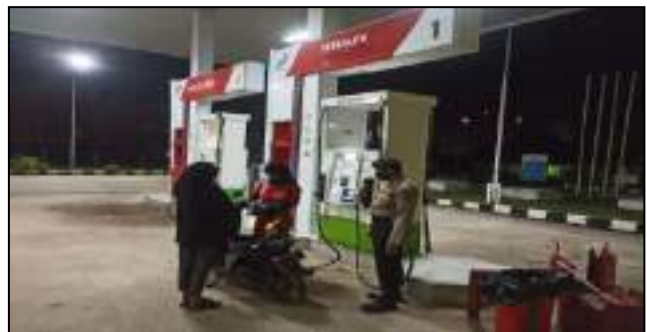
GIAT CEK / KONTROL LOKASI SPBU