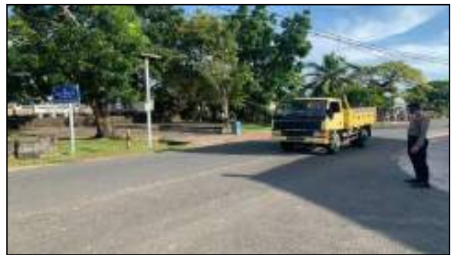
KEGIATAN PENGATURAN ARUS LALULINTAS MOBILITAS BERKENDARA SATSAMAPTA