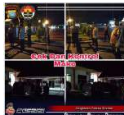
KEGIATAN PENJAGAAN MAKO DAN PENJAGAAN RUANG TAHANAN POLRES BINTAN