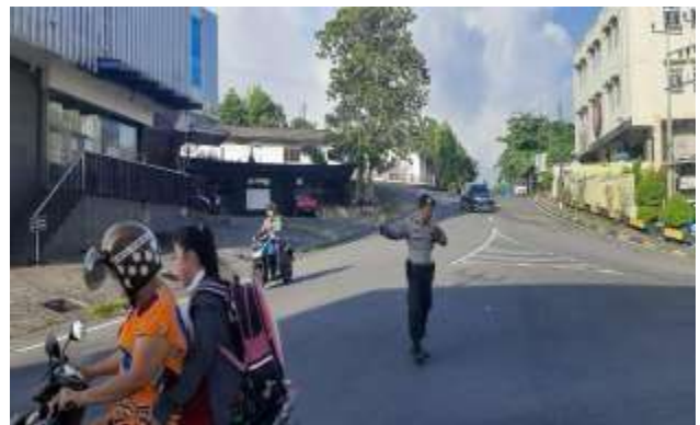
MELAKSANAKAN PENGAMANAN PH PAGI DI WILAYAH KEPOLISIAN RESOR KOTA TANJUNGPINANG