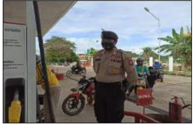
KEGIATAN PENGAMANAN SPBU DI DAERAH DABO SINGKEP DALAM RANGKA MENJAGA SITUASI KAMTIBMAS YANG KONDISIF