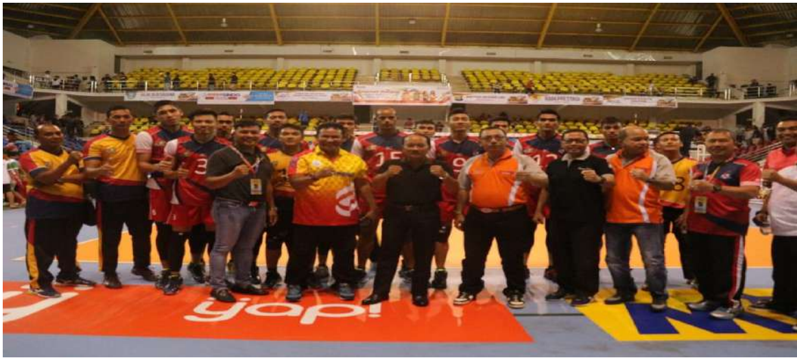
VIKON TERKAIT DENGAN BPK DI MAPOLDA KEPRI.