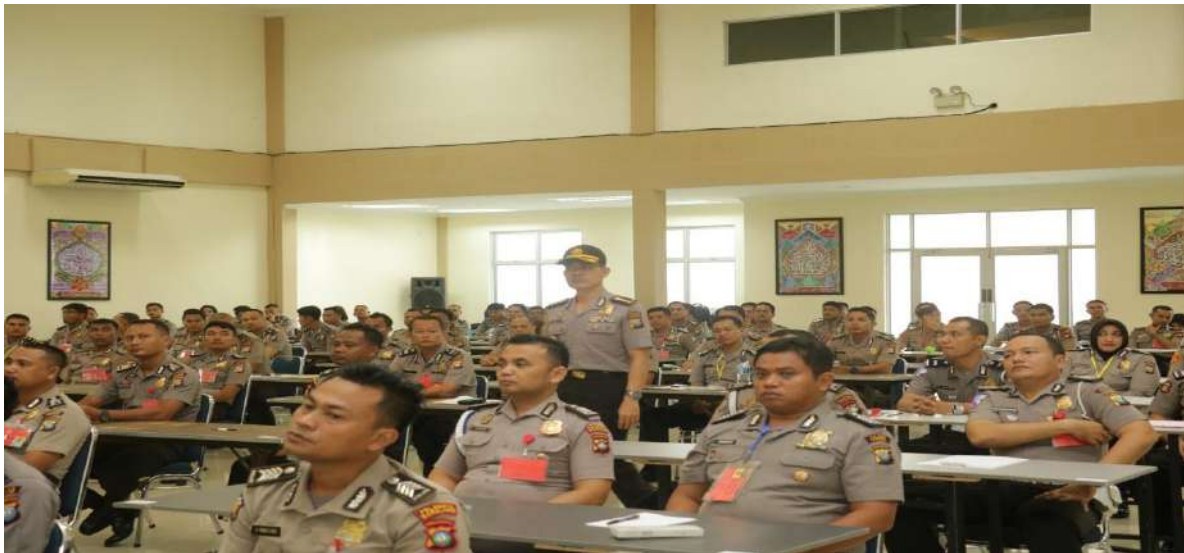
TAKLIMAT AWAL PEMERIKSAAN BPK RI DI JAJARAN POLDA KEPRI