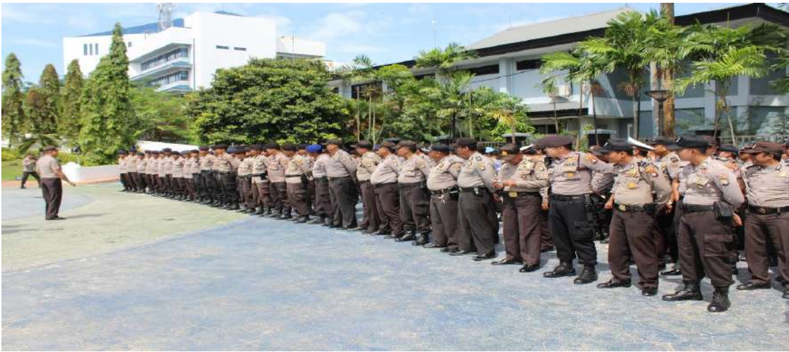
KEGIATAN KONFERENSI KERJA NASIONAL (PGR)